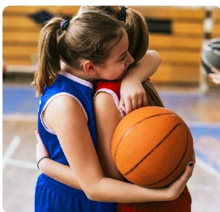
Ibercaja, patrocinador oficial de la Federación Aragonesa de Baloncesto.

Nos mueve apoyar el deporte con valores.